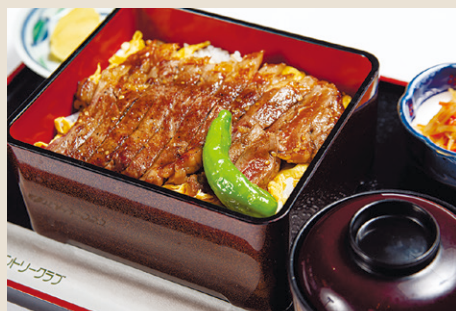
サーロインステーキ重 ..... 2,200 ミニサラダ・味噌汁・漬物 (税込 2,420)