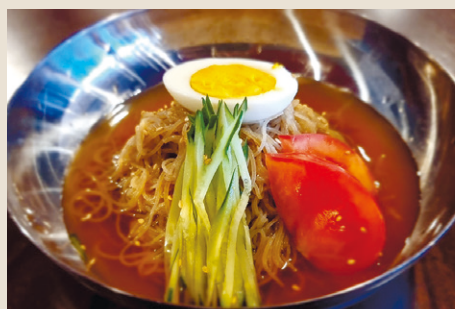
冷麺 ..... 1,200 キムチ (税込 1,320)