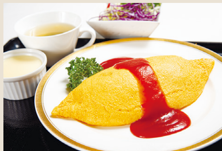
能登CC ふんわりオムライス ..... 1,400 ミニサラダ・冷製スープ・デザート (税込 1,540)