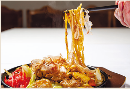
鉄板焼きそば ..... 1,400 温泉卵・デザート (税込 1,540)