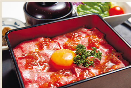
自家製和牛ローストビーフ重 ..... 2,000 ミニサラダ・味噌汁・漬物 (税込 2,200)