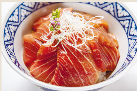
本鮪 中トロ漬け丼 ..... 2,200 ミニサラダ・味噌汁・漬物・わさび (税込 2,420)