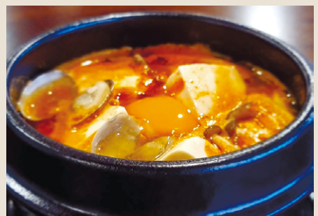
スンドゥブ (ホルモン入り) ..... 1,500 ご飯・キムチ・生卵 (税込 1,650)