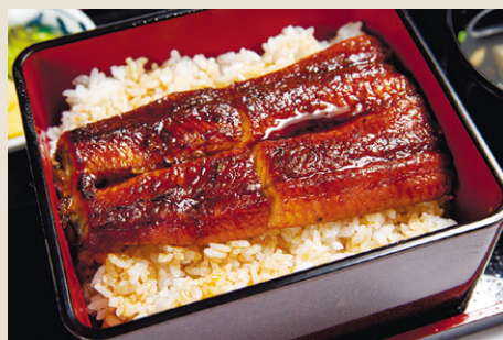
絶品 特上うな重 ..... 2,200 お吸い物・漬物・ミニサラダ・山椒 (税込 2,420)