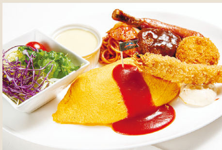
能登CC 大人のお子様ランチ ..... 2,200 ミニサラダ・冷製スープ・デザート (税込 2,420)