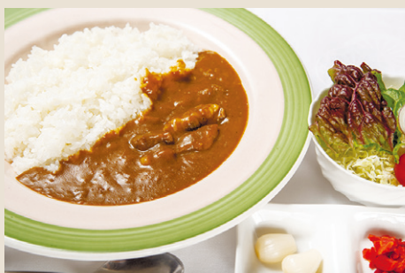
牛すじ煮込みカレー ..... 1,400 ミニサラダ・薬味 (税込 1,540)