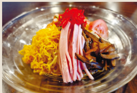
五目冷やし中華 ..... 1,500 からし・マヨネーズ (税込 1,650)