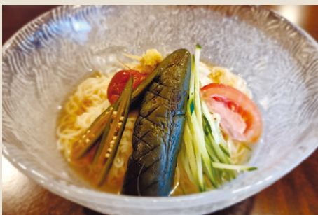
夏野菜冷やしそうめん ..... 1,200 (税込 1,320)