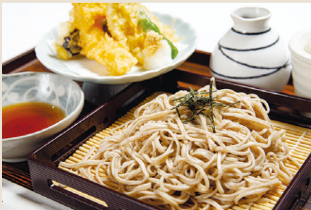
天ざる十割そば・天ざる稲庭風うどん 天つゆ・薬味 ..... 1,600 (税込 1,760)