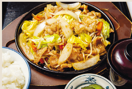
秘伝のタレ 鉄板ホルモン炒め ..... 1,800 ご飯・味噌汁・漬物 (税込 1,980)