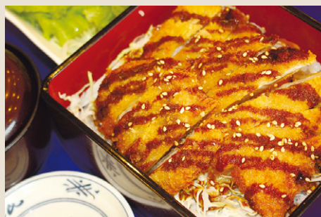
国産豚ロースのソースカツ重 ..... 1,600 ミニサラダ・味噌汁・漬物・からし (税込 1,760)