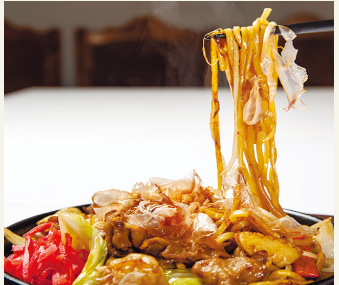
鉄板焼きそば ..... 1,400 温泉卵付 (税込 1,540)