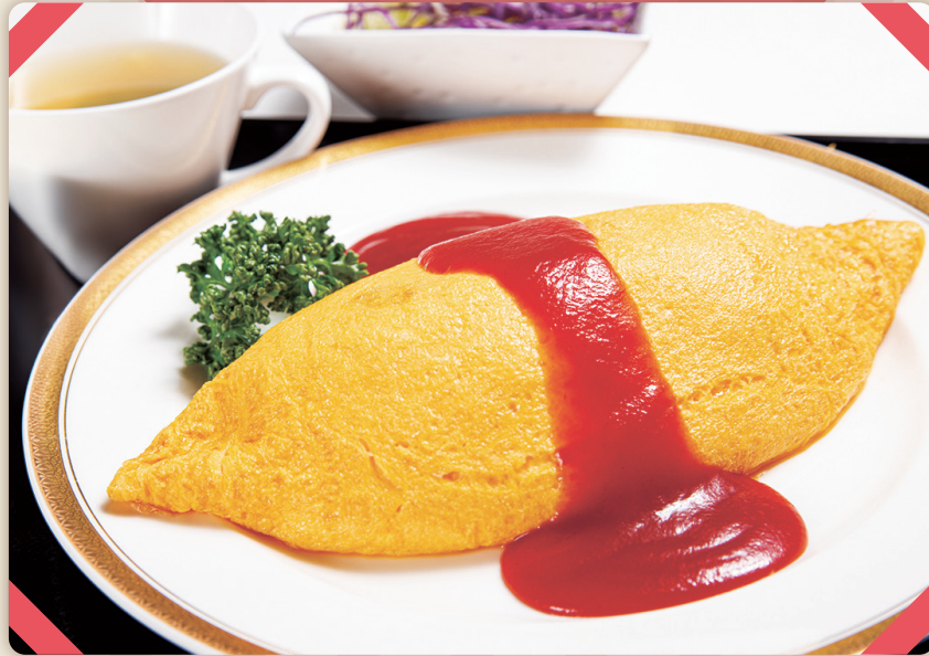
オムライス ..... 1,600 ミニサラダ・スープ付 (税込 1,760)