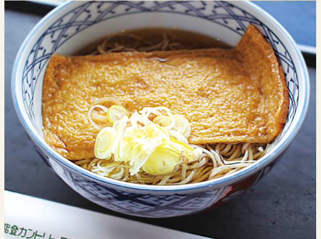
きつねそば ..... 1,200 (税込 1,320)