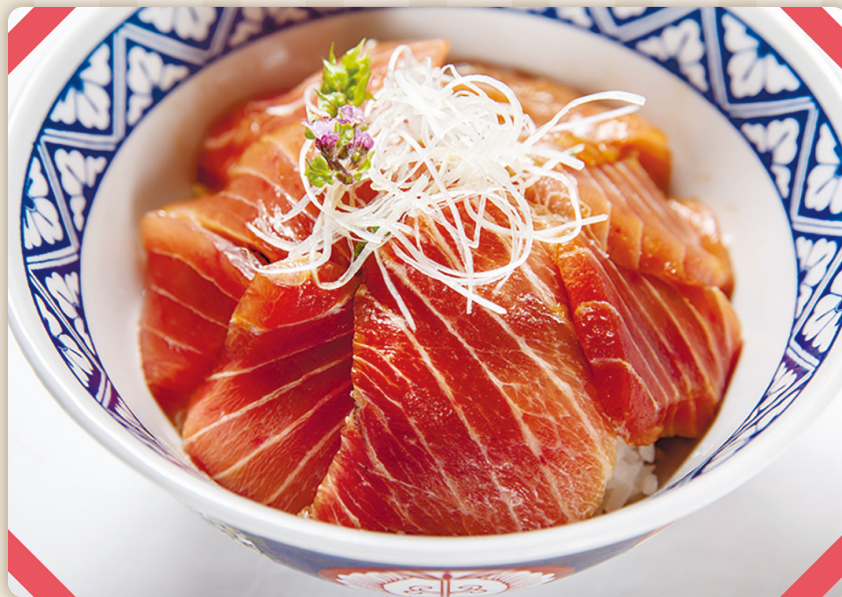
【本鮪】中トロ漬け丼 ..... 2,200 わさび・ミニサラダ・漬物・味噌汁付 (税込 2,420)