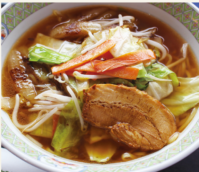
野菜醤油ラーメン ..... 1,600 (税込 1,760)