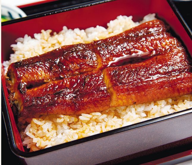
うな重 ..... 2,200 ミニサラダ・漬物・お吸物付 (税込 2,420)