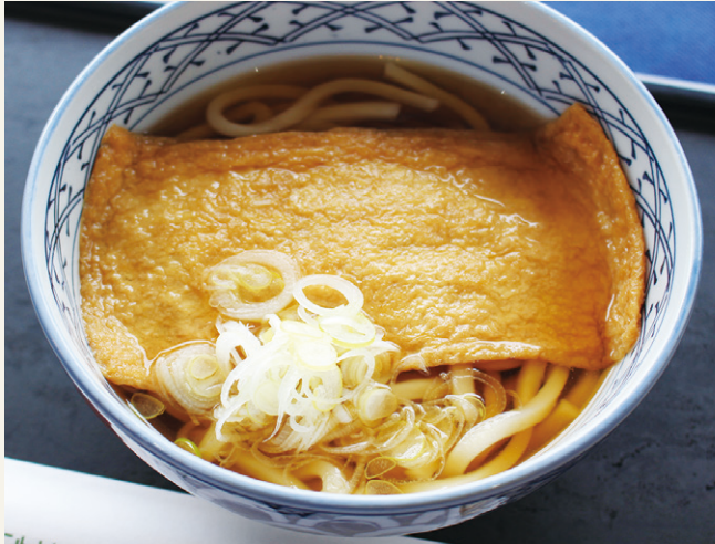
きつねうどん ..... 1,200 (税込 1,320)