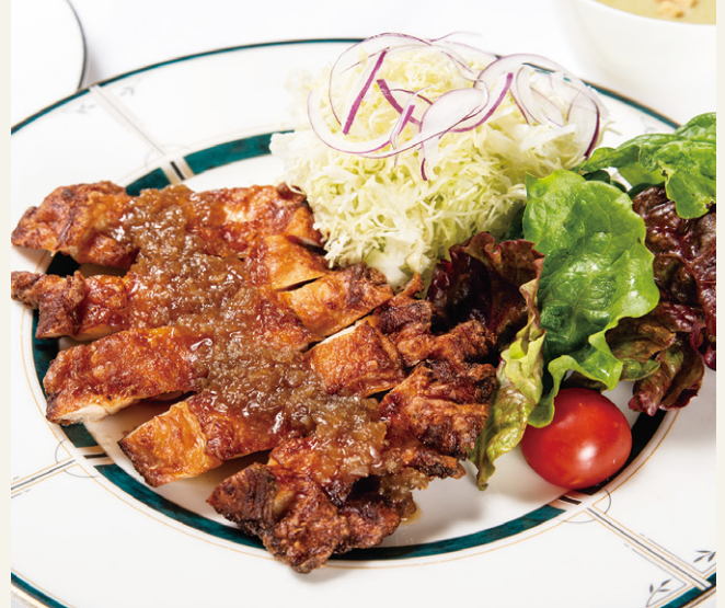
チキンステーキ ..... 1,800 ライス・スープ付 (税込 1,980)