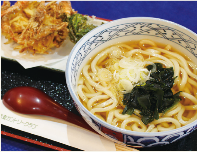
かき揚げうどん ..... 1,600 (税込 1,760)