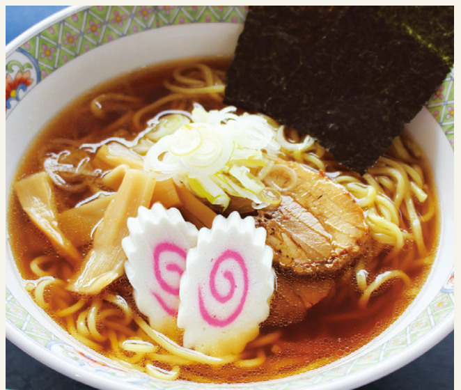
醤油ラーメン ..... 1,300 (税込 1,430)