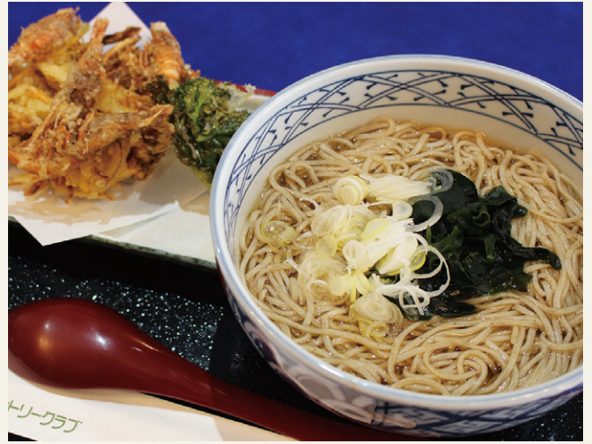
かき揚げそば ..... 1,600 (税込 1,760)