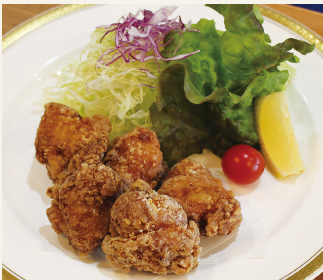
から揚げ定食 ..... 1,800 ご飯・漬物・味噌汁付 (税込 1,980)