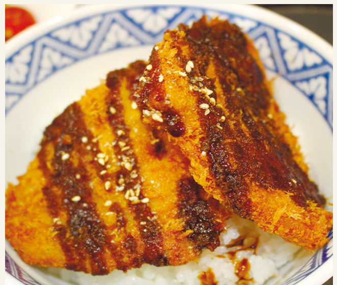
ソースカツ丼 ..... 1,600 漬物・味噌汁付 (税込 1,760)